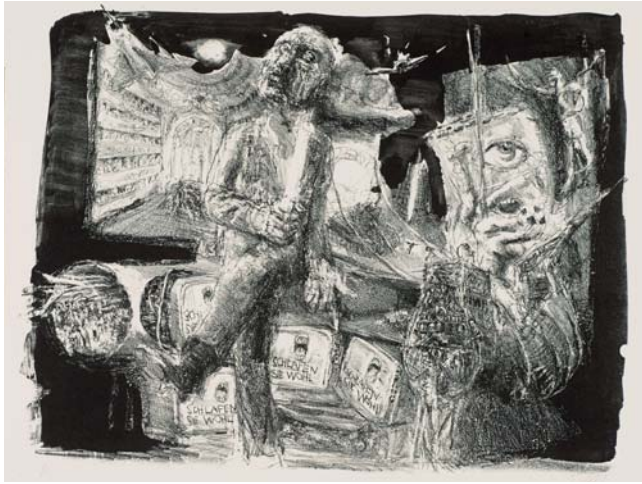
Lichtbringer, 1982, Lithographie (Kreide, Tusche), 35,5x46,5 cm

1990, zu verdanken. Die Fähigkeit, sich in die bildnerischen Absichten Heisigs hineinzudenken und diese drucktechnisch umzusetzen war Arloth in höchstem Maße gegeben. Heisig schrieb noch im Jahr 2000: »Ich konnte auf dem Stein mit seiner Hilfe vieles tun und dem Material manches abverlangen, von dem ich manchmal meinte, es sei nicht zu machen.« Der künstlerischen Mentalität Heisigs kamen vor allem die facettenreichen Tonwerte und malerischen Strukturen der Kreidelithografie entgegen. Aus der Porosität der kurzen Kreidestriche erwachsen Gestik und Physiognomie seiner Bildgestalten, deren Vergegenwärtigung während des Arbeitsprozesses vielfache Verwandlung erfuhr. Die bedrängende Flut innerer Bilder hat er u. a. in den lithografierten Werkreihen zur »Pariser Commune«, zu Ludwig Renns Roman »Krieg«, den Illustrationen zu Bertolt Brechts »Mutter Courage und ihre Kinder« und zum »Dreigroschenroman« festgehalten. Horst Arloth druckte auch den Zyklus »Der faschistische Alptraum«, ein Schlüsselwerk im Schaffen Heisigs. Mit dieser Folge begann sich der Künstler seit Mitte der 1960er Jahre den bedrängenden Fragen nach den Bedingungen und Folgen von Faschismus und Krieg in der deutschen Vergangenheit zu stellen. Die Wurzeln dieser Gestaltung liegen in den eigenen traumatischen Kriegserfahrungen, die von ihm immer wieder reflek-