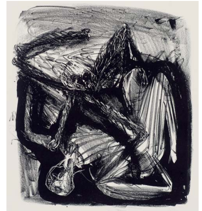
Der faschistische Alptraum, 1965/1966, Die Spinne, Lithographie (Kreide, Tusche), 40,4x36,3 cm

Im Werk des Malers und Grafikers Bernhard Heisig begegnen sich in einer fulminanten künstlerischen Sprache eigenes Empfinden und Zeitgestalt. Aufgrund der besonderen ästhetischen Dimension seines Schaffens zählt er zu den wichtigsten Vertretern der Leipziger Kunst in der zweiten Hälfte des 20. Jahrhunderts. Seine grundlegende formale Entwicklung setzt in den 1960er Jahren ein, wobei die Verarbeitung seelischer Spannungen und die Auseinandersetzung mit existentiellen Fragen des Seins seine Hauptanliegen werden. Mit dramatischen Bewegungen und raumgreifenden Verschränkungen gestaltet er seine Themen als Zusammenballung und Entladung exzessiv wirkender Energien in geschichtlichen Zusammenhängen. Die bildhaften Verdichtungen